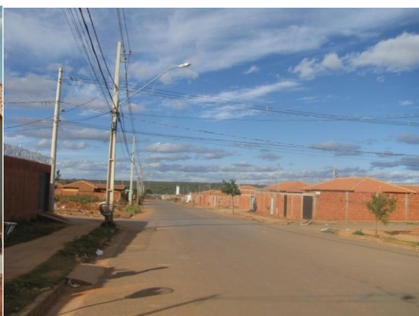
Figura 3: Residencial Nova Suíça em 2015.