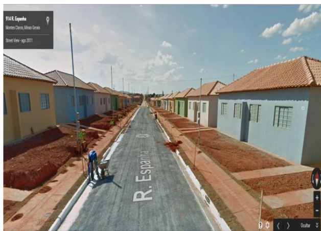
Figura 2: Residencial Nova Suíça em 2011.